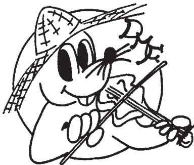
イメージキャラクター「マッキー」