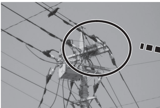
電柱上に作られたカラスの巣 (遠距離から撮影した写真)

カラスの営巣を発見された場合には、ご連絡をいただくとともに、巣の材料となる針金ハンガー等を持ち去られぬようご協力をお願いします。