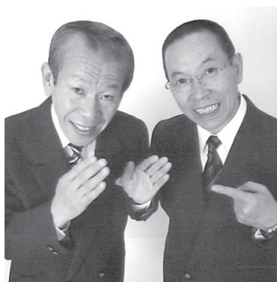
昭和のいる・ こいる