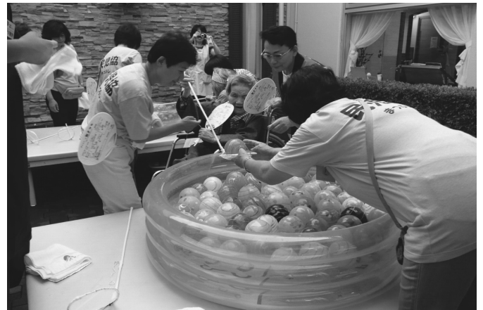
ヨーヨー釣りのお手伝い