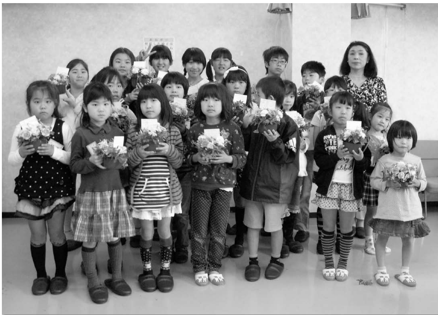
大好きなお母さんへ「ありがとう」の気持ちを込めて!【5月12日】 ▶詳細は9ページ