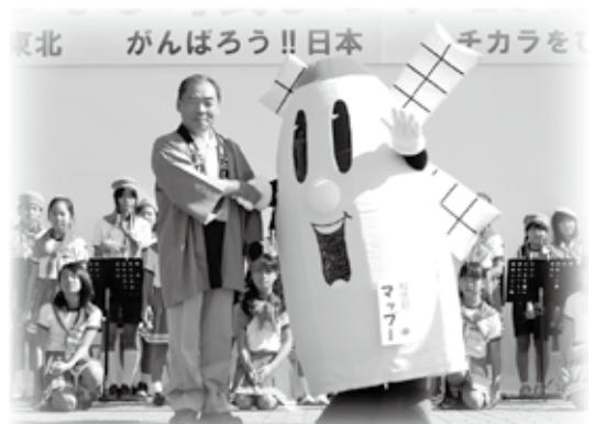
【マップー初お披露目！】