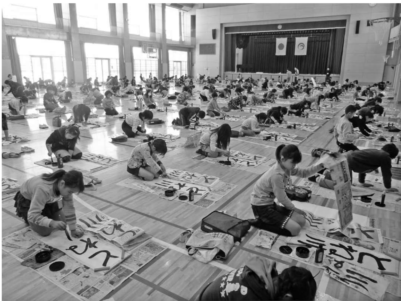
松伏小学校で、校内書き初め競書会が行われました【12月10日・11日】 ▶詳細は10ページ