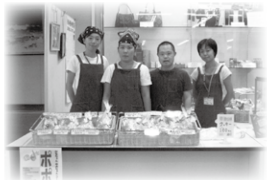
【役場本庁舎にオープンした「ポポ歩」】

町民の皆様にとりまして、今年一年が幸多き年となりますよう心からお祈り申し上げ、新年のご挨拶とさせていただきます。