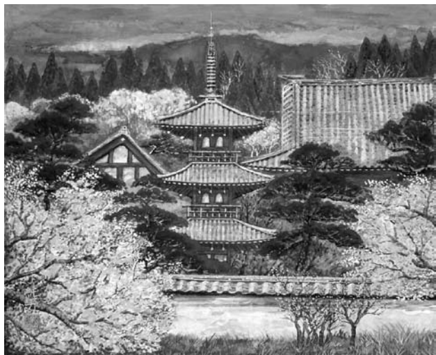
「春映大和」