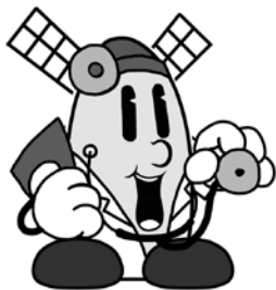
けんこう大使 マッパー

町では国民健康保険に加入している40歳から74歳までの方を対象に特定健診を実施しています。