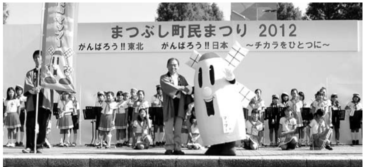
マップーが着ぐるみになって初お披露目！ (「まつぶし町民まつり2012」より)