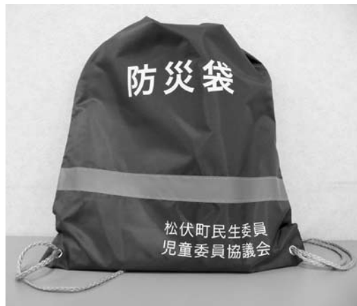
高齢者のひとり暮らしの世帯へ配布する 防災袋