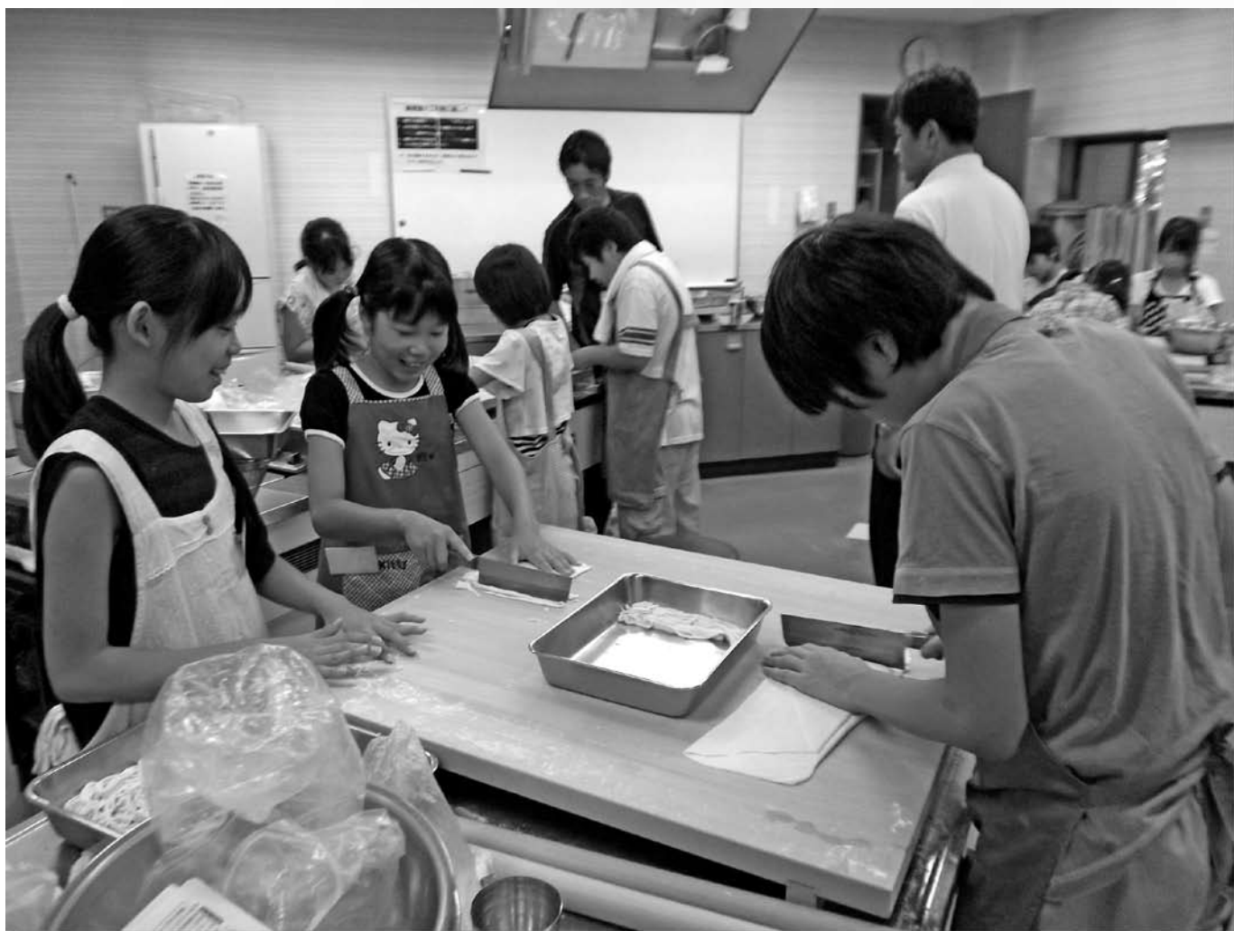
「夏休み一日体験塾」で、うどん作りにチャレンジ!【8月2日】