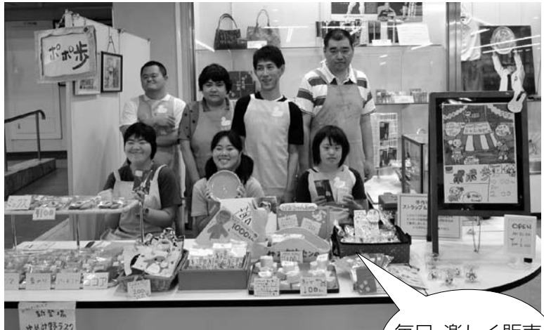
かるがもセンターの皆さんです

■問合せ／町立かるがもセンター ☎992-4132 ゆめみ野工房 ☎993-1110