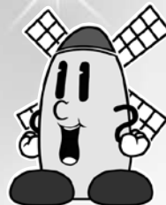
松伏町のキャラクター マップー