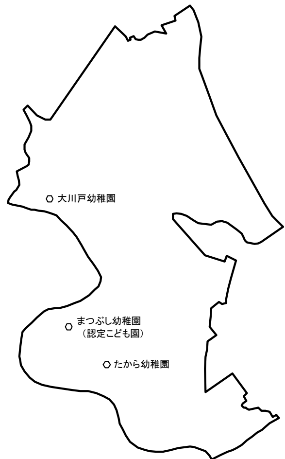
町内の幼稚園の位置

町内には、たから幼稚園、まつぶし幼稚園、大川戸幼稚園の3園の幼稚園（認定こども園を含む）があります。