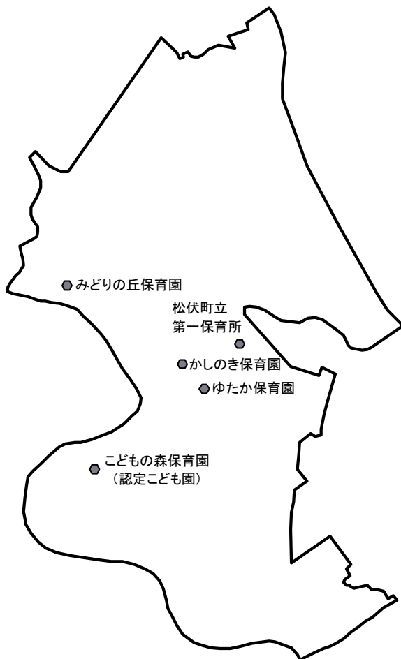
町内の保育所（園）の位置