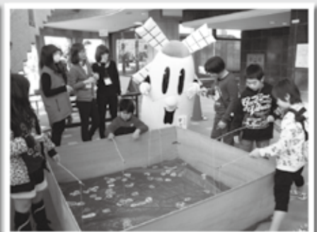
“子育て”文化のまちづくりフェスタに参加(平成25年12月)