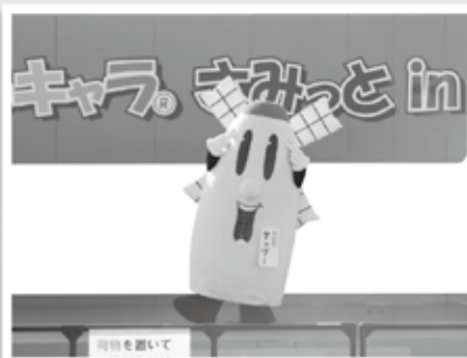
ゆるキャラ@さみっとin羽生に参加！(平成25年11月)