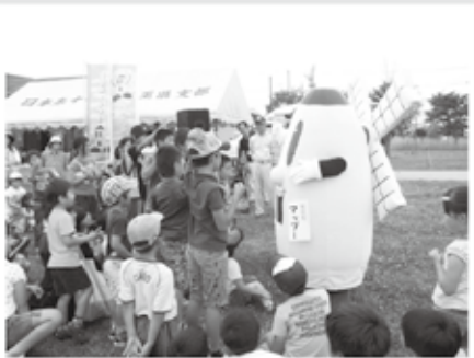
ポピーまつりで、子どもたちとじゃんけん大会(平成25年6月)

明けましておめでとうございます！ 今年もいろいろなところへお出かけします！ 僕と一緒にたくさん遊ぼうね！