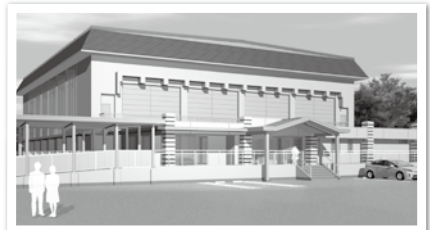
松伏中学校体育館完成予想図

また、松伏中学校体育館の大規模改修工事の完了により、教育環境の充実及び防災力の強化を図ります。