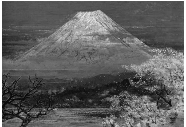
「春映富士」(後藤純男美術館より写真提供)