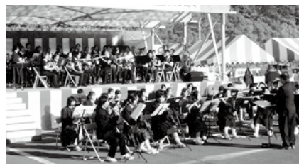
松二中(ステージ上)、山下中・坂元中による合同演奏