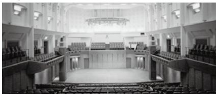
▲田園ホール・エローラ