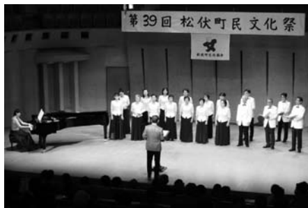
昨年の町民文化祭