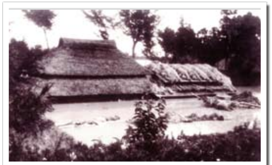
▲カスリーン台風により軒下まで水没した家屋(大川戸地区)