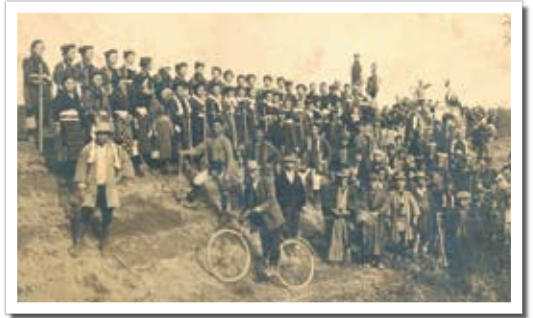
▲明治43年の水害の時の地域住民による古利根川堤防修復工事(寿橋近辺)

お住まいの地域に自主防災組織が設立されている方は、積極的に自主防災活動に参加し、「災害に強い町」をつくりあげましょう。もしお住まいの地域に自主防災組織が設立されているか分からない場合は、自治会などに確認してみてください。設立されていない場合は、ぜひ地域の皆さんで設立し、災害に備えましょう。自主防災組織には、町から防災資機材の貸与、運営補助金の支給を行っています。設立については総務課庶務防災担当(☎991-1983)へご相談ください。