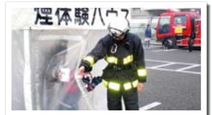
▲松葉地区松葉連合自治会自主防災会の防災訓練