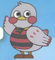
埼玉県のマスコット「さいたまっちゃん」