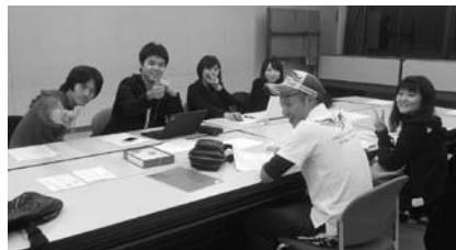
▲実行委員会「みんなですばらしい会にしましょう！」

日 1月10日(日)(成人の日の前日)午後1時開会(午後0時15分受付開始) 場 田園ホール・エローラ(中央公民館) 対 平成7年4月2日から平成8年4月1日生まれの町内在住の方 ※町外へ転出し、松伏町の式典に参加希望の方は教育文化振興課までご連絡ください。 申・問 教育文化振興課 ☎991-1873