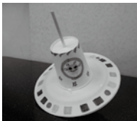
▲パクパクししまい ▲UFOごま