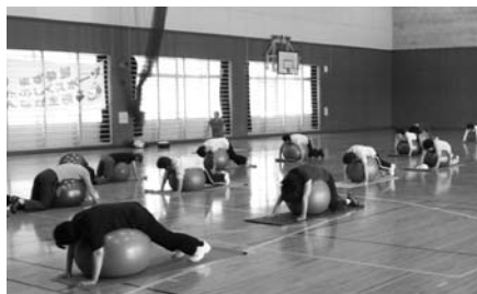
▲ストレッチ&バランスボール

※上記5教室は、場 B & G 海洋センター、対 16歳以上の方、費 300円(保険代など)。マッピーメンバーシップカードの割引適用あり。