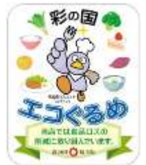
「彩の国エコぐるめ」協力店の登録証

小盛りメニューの設定や、量り売りなど、食品ごみの削減に取り組まれている事業者を登録、事業者にはステッカーを配布し、ホームページで紹介しています。