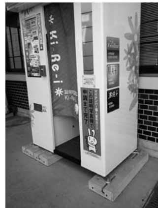
吉川市役所に設置されている申請機能を備えた証明写真機

答 福祉健康課長 町では点字図書が対象になっているものの、大活字図書、デジジー図書は対象になっていない。大活字図書やデジジー図書の給付について普及した際に活用できるよう、平成29年度に向けて規定の整備を進めていく。