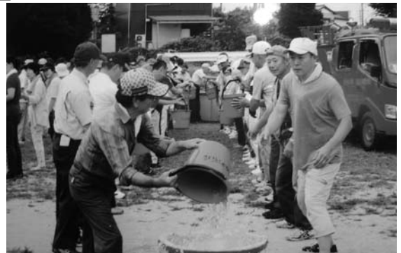
自主防災組織をめざした防災訓練の様子

答 教育文化振興課長 職員の日常点検と利用者からの通報で、速やかな確認措置を行い施設の安全衛生管理に努める。未然に事故を防ぐため、チェックシートによる予防保全管理を導入し、施設内巡視も強化する。また、B&Gトイレの洋式化にも取り組む。