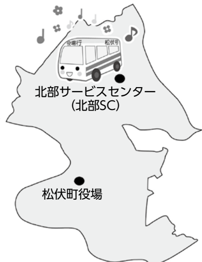
仮称 北部地区を快走する「松伏号」

答 町長 高齢化率も上がり環境も変わって来た。何らかの手を打つ時期が来た。検討会議を設置し地域の実情を把握するよう指示する。