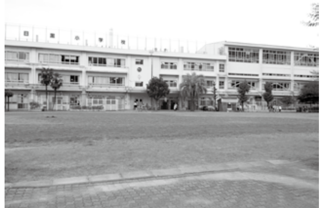
校庭の大半が芝生化されている目黒区内の小学校

答 教育総務課長 維持管理は、委託も含めて地域の協力など、研究していきたい。全校芝生化の推進は、各校の校庭の状況が異なり、校庭が使用できない時期が発生するため慎重に判断したい。