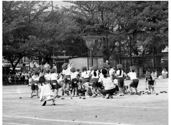
何個入ったかなあ

答 教育文化振興課長 コミュニティスポーツは、心身の健康保持、増進、そして地域コミュニティの形成に役立っている。しかし、コミュニティスポーツ大会の実施については考えていない。