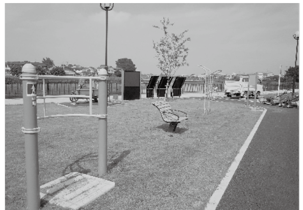
「かがり火公園」に設置されている健康遊具

答 教育総務課長 各教科、領域を通じて行っている。小学校では町探検や文化財、歴史を学ぶ機会をつくり、町の良さを学習している。中学校では企業、施設の協力を得て、老人介護施設への訪問や社会体験活動を行っている。地域を知り、人や歴史を知り、この松伏をさらに愛する教育は今後も推進していきたいと考えている。