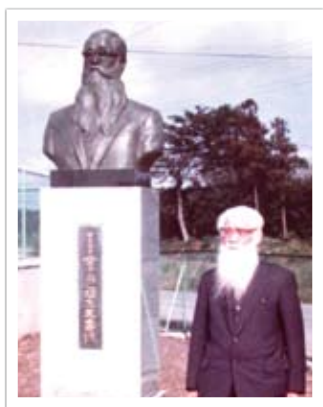
▲昭和55(1980)年金杉小学校に寿像完成

これらの功績から、昭和52(1977)年に勲三等瑞宝章受章、昭和55(1980)年に松伏町の初代名誉町民となりました。