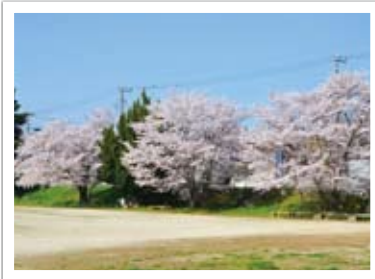
▲今月オープンする松伏町北部サービスセンター(旧老人福祉センター)