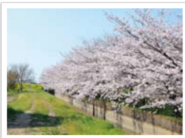
▲二郷半領用水路沿い(赤岩橋付近)からし菜も一緒に楽しめます