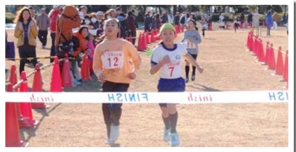
▲ラストスパート！小学3・4年女子1500m(第37回)