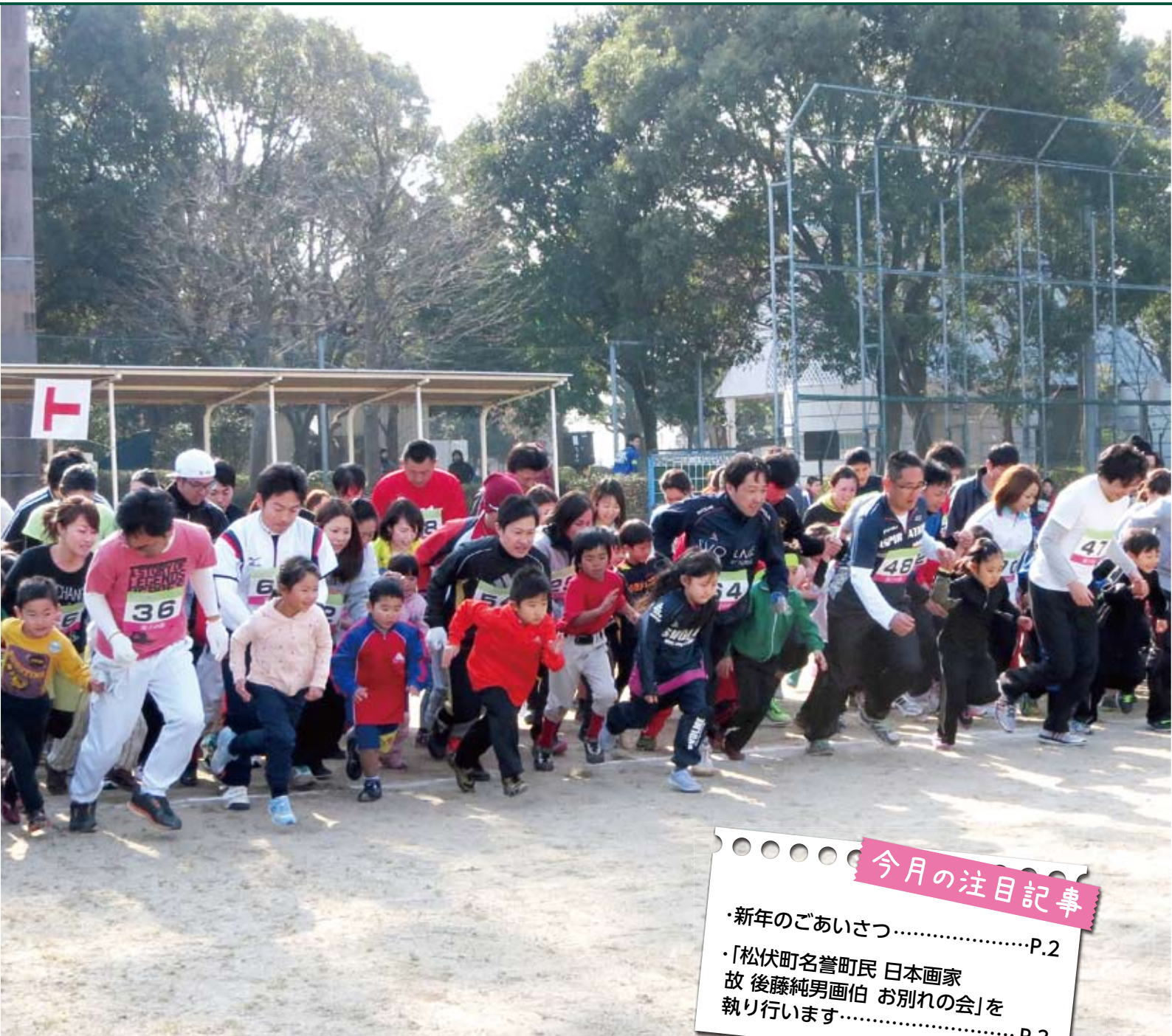
▲親子で力をあわせて700mをダッシュ! (第41回松伏町新春ロードレース大会)