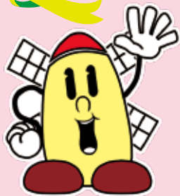
松伏町 PRキャラクター マップー