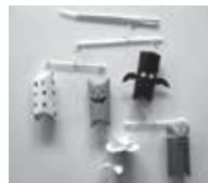
▲ハロウィンモビール

☎・☎10月14日「ハロウィンモビール」10月28日「コロコロちゃん」いずれも土曜日 午後3時～3時30分 ☎無料。直接会場へお越しください。