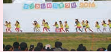
▲まつぶし町民まつり2016ステージ