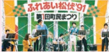
▲第1回町民まつりステージ

ぜひ、皆さんでお越しください。詳しくは、今月号の折込チラシ又は町ホームページをご覧ください。