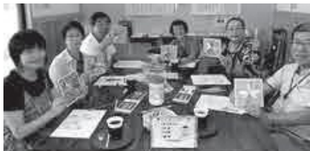
オレンジカフェの様子