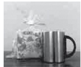
昨年のプレゼント