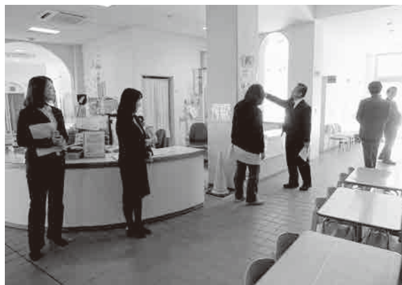
児童館ちびっ子ランド

1月24日（水）午前は、児童館とかるがもセンターの訪問調査を行なった。児童館は、既存事業の回数増、新事業やイベントの実施で、子育て支援の充実を図り、年間利用人数は6万人となっている。町内利用者が60%、町外利用者は40%で、町外からの利用者は個人ネットワークのつながりで来ているとの説明を受けた。かるがもセンターでは、施設の老朽化による補修の必要性や管理運営の課題、利用者と職員体制の現状について、質疑に対する説明を受けた。午後は、地域子育て支援センターの業務内容、事業内容の説明を受け、町の子育て支援拠点事業の制度と現状について理解を深めた。