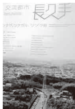
市民平均年齢38.6歳の長久手市

答 町長 1課に長くいるのも弊害が生じることがあり、定期的人事異動が必要。変化を恐れてはいけない。変化に対応したものだけが行政であっても人であっても生き残れる力を持つ。変化に勇気を持って挑もうと職員に伝えている。