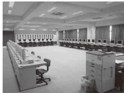
松伏第二小学校のコンピュータールーム

答 総務課長 戦略の目的達成の中心は総務課商工担当である。今後については、各課に情報発信担当を任命し、松伏町全職員が一丸となって、シティプロモーションを実施したいと考えている。