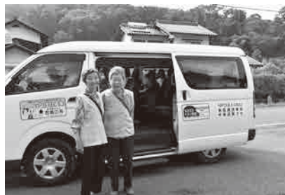
交通空白地域で実施しているNPOによる有償運送（鳥取市）

いるところにある。検討会の中間とりまとめの中では「高齢者の生活実態や公共交通機関の現状を考えると、公共交通を補完するボランティア団体の活動や地域の助け合いの中で確保していくことも、今後重要性を増す」とされている。ボランティア団体等による、高齢者の移動手段の確保を行うために、町交通部局からの情報提供を受けながら、実証実験も含め調査・研究をしていきたい。