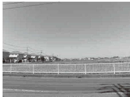
「町の将来にどのような影響があるのか。」 (産業団地予定地)

第5次総合振興計画の策定時に想定していた新市街地の整備等をはじめとする主要な事業を前進させ、計画全体の進捗を高め住民の信託に応えたい。