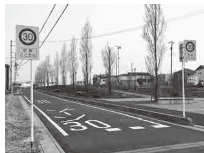
「ゾーン30」導入事例(越谷市)

答 教育総務課長 昭和61年11月完成以来、30年余りが経過、老朽化が進んでいる。雨漏りについては、来年度以降修繕の予算内で対応する。また町として、小中学校へのエアコン導入を優先して進めているので、エアコン導入後に調整のうえ、大規模改修を検討する。