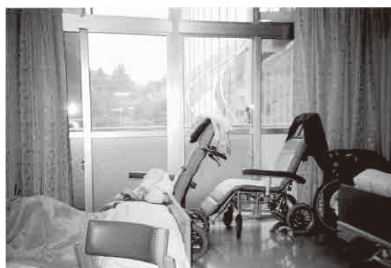
特別養護老人ホーム

答 いきいき福祉課長 地域包括ケアシステムの構築は、①在宅医療と介護の連携、②認知症の総合支援、③日常生活の支援体制の整備、④地域ケア会議の推進を行うことである。