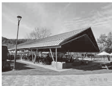
防災機能を備えた道の駅先進事例 (道の駅「川場田園プラザ」)

問 平成30年度の国の税制改正の町財政への影響は。 答 税務課長 地方消費税の精算基準を社会経済情勢や統計制度の変化を踏まえ、地方消費税の税収をより適切に最終消費地に帰属させる見直しが行われる。増額する町への交付額は社会保障費に当てる。