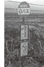
「通称春バス」バス停

答 いきいき福祉課長 松伏町生活支援体制整備協議体の中で、有償ボランティアも含めて議論する。