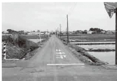
拡幅整備をまたれる町道4号線