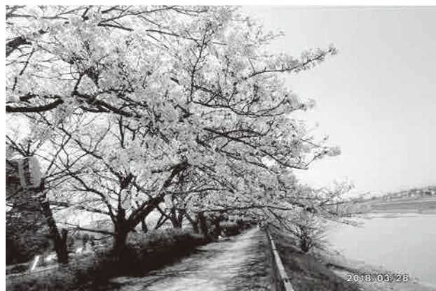
桜吹雪の中を歩ける桜コース

答 教育総務課長 学校からの月例報告などで不登校の状況を把握し、不登校の解消をする。