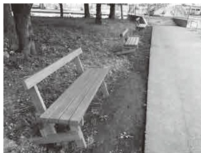
役場に寄贈された木製ベンチ

答 総務課長 設置者責任として、ベンチそのものの安全性をどのようにクリアするかなどの課題もあるので、しっかりと調査して行く。