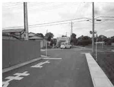
拡幅された町道745号線と3号線の通学路交差点

答 町長 10%削減は大変ではあるが、枝木の搬入だけで松伏町は年間を通して10%あり、そこをどうにかすることで可能と思う。未来の子供たちのため、努力する気持ちを町全体で共有していきたい。