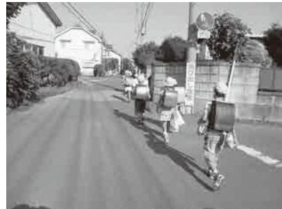
1時間近く徒歩で通学する下赤岩岩平地区の児童