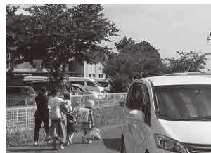
下校時の親の送迎は増えている(金杉小学校前)

答 教育総務課長 徒歩で子どもたちだけで登下校するのも意義がある。教育委員会では、引き続き防犯教育を実施し推奨することで安全の確保を図っていく。