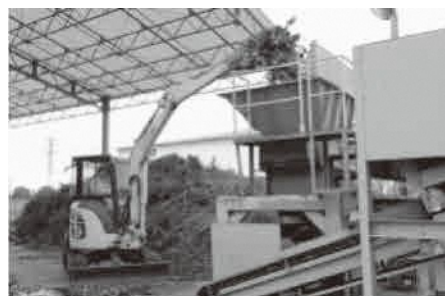
剪定枝などの堆肥化施設 (東埼玉資源環境組合)

他「遊歩道などのベンチの増設、トイレの新設を求める」、「道徳の教科化について」質問した。