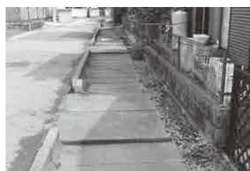
段差のある排水路

町長 決して近くに道の駅がいくつかできたからといって、マイナスには、考えない。越谷の道の駅で半日遊んで、松伏町で半日遊んで帰れば、1日東部地区で遊べるような地域づくりが逆にできるのではないかとこの形で連携をとっていきたい。