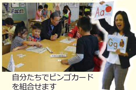
自分たちでビンゴカードを組合せます