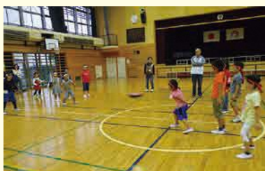
たのしい😊ドッジビー