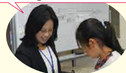
児童に大人気! アルファベットビンゴ