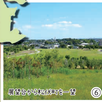
展望台から松伏町を一望