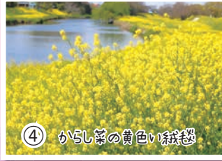
④ かし菜の黄色い絨毯