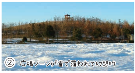
② 広場ゾーンが雪で覆われて幻想的