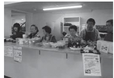
メロディーカフェの様子