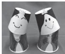
▲くびふりおひなさま