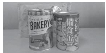
昨年のプレゼント