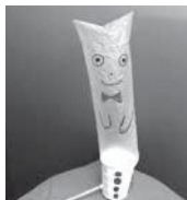
▲モコモコくん 広告

◎・◎2月9日「モコモコくん」 2月23日「くびふりおひなさま」 いずれも土曜日 15:00~15:30 場1階ホール 費無料。直接会場へ。