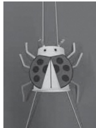
▲するするてんとうむし