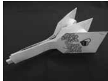
▲チューブプレーン ▲牛乳パックの鳴子