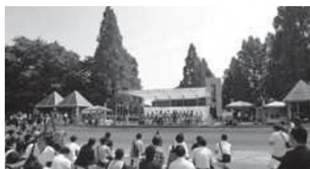
イベントで賑わう松伏総合公園

答 総務課長 避難所への誘導訓練は避難所開設訓練を発展させ、住民とともに「命を守る」初動訓練や避難誘導訓練も含めた形で、来年度以降に取り組んでいきたい。