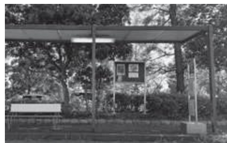
松伏高校前バス停脇の自衛官募集の掲示板

答 新市街地整備課長 自衛官募集の掲示板が、公序良俗に反しないと判断し、松伏記念公園内の松伏高校前バス停脇に設置する申請を許可した。