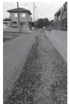
一部未舗装の町道 (金杉地内)

答 教育総務課長 活字離れの解消、読解力、思考力、情報活用能力を高める効果が期待できる。