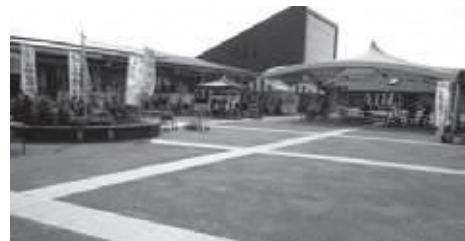
春日部市内(旧庄和町)にある「道の駅庄和」

答 新市街地整備課長 何か特色的なものがあれば、越谷に寄った人も松伏に寄っていただけだと思う。越谷と松伏、競争してどっちが勝つという考えは持っていない。