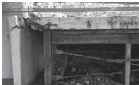
松伏中学校プール状況

答 町長 合併の機運が来るまでに、財政指数0.64を少しでも上げていくのが私の仕事と認識している。地下鉄8号線が来るならば、このときに市町村の負担金は200億円とも300億円とも言われている。これまでに合併をしておかなければ、私はこの町としては地下鉄の誘致をする力はないと思っている。この2点から、なるべく力の強い松伏町をつくっていきたいと思っている。