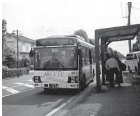
地域を活性化する路面バス

答 新市街地整備課長 鉄道駅のない当町において、コンパクトシティの中心拠点はゆめみ野地区の商業施設があるエリアになり、既にコンパクトなまちづくりはできている。