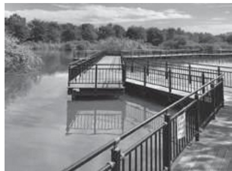
まつぶし緑の丘公園 水辺ゾーンの池