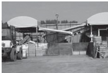
雨ざらしで修理を重ねている、中間処理場の機器

答 環境経済課長 直近の粗大ごみのリサイクル率は、受け入れ量が約180トンで資源化した量はおよそ84トン、残りは、燃えるごみ等となり、リサイクル率は約46%だった。