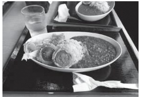
美味しい北本トマトカレー

北本市は、トマトカレーで「全国ご当地カレーグランプリ優勝」など、トマトとその歴史をまちづくりに活用している。また、トマトカレーの取り組みについては、市は側面的に支援をし、実際の商品開発は観光協会や北本トマトカレーの会が中心に実施している。