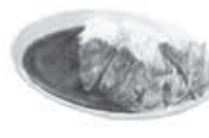
3 café 上赤岩864-1 ☎940-3307