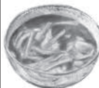
そば処 司庵 松伏2431-1 ☎992-1266