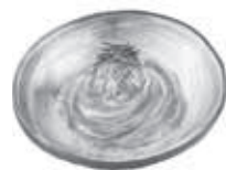
うなぎ料理専門店 川昌 金杉1511-2 ☎992-0123