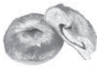
ホームベーカリー チャコス 松伏638 ☎991-6760