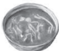
そば処 桂 築比地1449-7 ☎992-0487