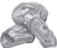
ブードル洋菓子店 ゆめみ野6-1-50 ☎992-4911