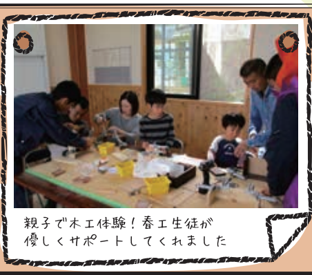
親子で木工体験!春工生徒が 優しくサポートしてくれました