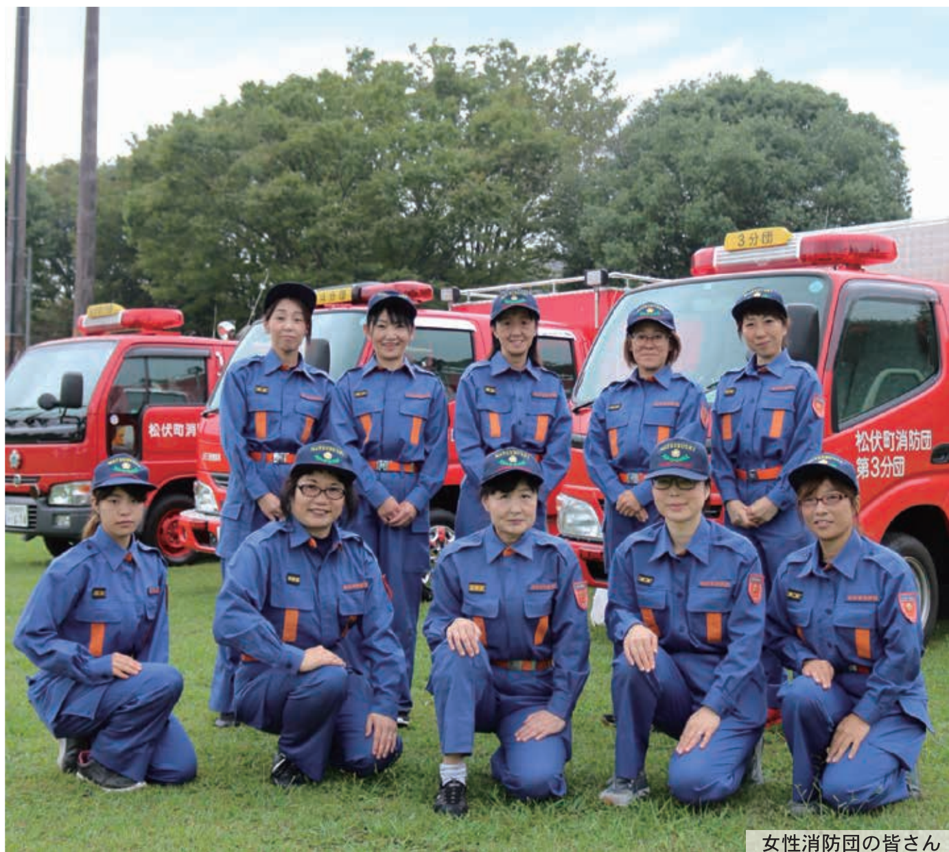
女性消防団の皆さん