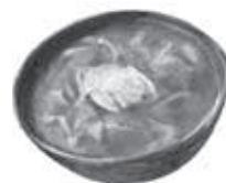
まるか家 松伏369-6 ☎992-4630