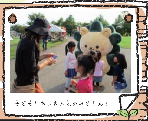
子どもたちに大人気のみどりん!