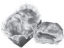
ブランジェ・アプレ ゆめみ野4-1-17 ☎992-0290