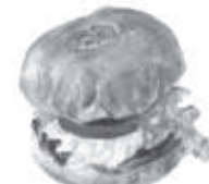
気まぐれダイニング 松伏 MACHIBUSE 松伏1999-9 ☎972-5656