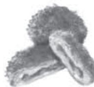
鳥久 松伏2473 ☎991-2607