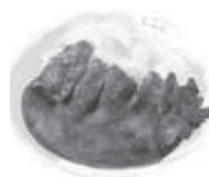
きそば なかだ ゆめみ野6-17-2 ☎991-6963