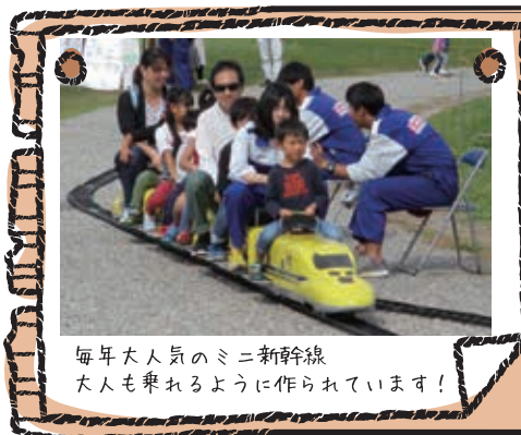
毎年大人気のミニ新幹線 大人も乗れるように作られています!