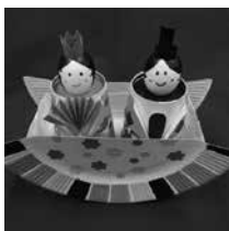
▲ユラユラ おひなさま

☎・☎2月8日「ユラユラおひなさま」、22日「パクパクくん」 いずれも土曜日 15:00~15:30 場1階ホール 費無料。直接会場へ。