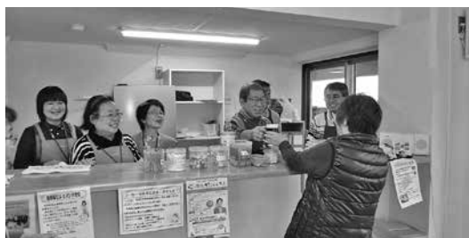
メロディーカフェの様子