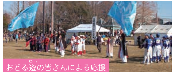
おどる遊の皆さんによる応援