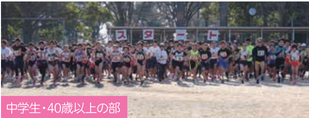
中学生・40歳以上の部