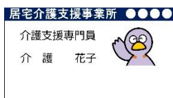
ケアマネジャーの 名刺