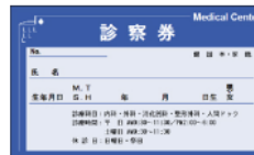
かかりつけ医の 診察券