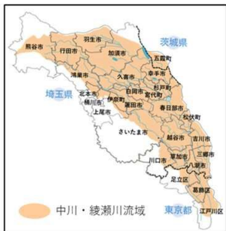
中川・綾瀬川流域を 含む市町（24市町）

令和7年7月1日から、中川・綾瀬川流域においては、特定都市河川浸水被害対策法（以下、「特定都市河川法」という。）が全面的に適用され、流域内の市町において宅地等以外の土地で行う1,000㎡以上の雨水浸透阻害行為（土地の締固めや開発などにより雨水が染み込みにくくなる行為）には、知事等の許可が必要となり、流出雨水量の増加について対策（貯留・浸透施設の設置）を求めます。（特定都市河川法第30条の許可） 許可の窓口は、対象面積や市町により異なりますのでご注意ください。