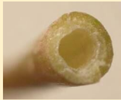
茎の断面 * 1