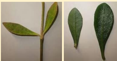
葉の形状 * 1